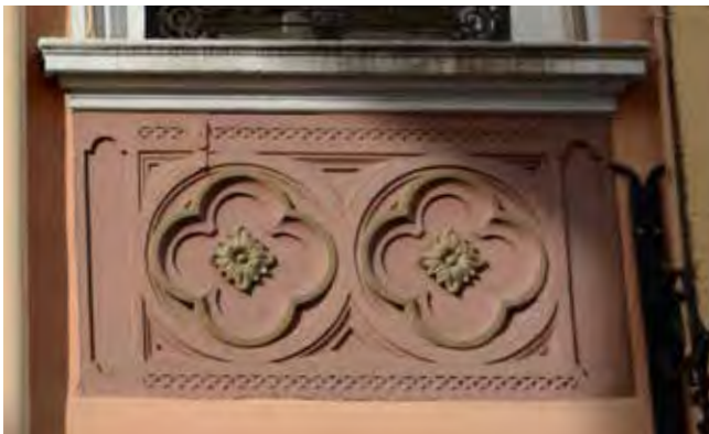
Architekturdetails im Bereich der Fassade zum Zeitpunkt der Bestandserfassung 10/2019