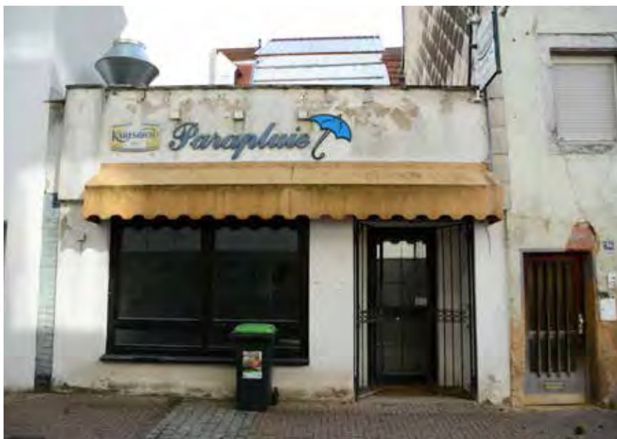
Leerstehender Gastronomiebetrieb im Bereich der Untergasse zum Zeitpunkt der Bestandserfassung 10/2019

Weitere Ziele der Kreisstadt Homburg sind zudem die Sicherung historischer Gebäudesubstanz sowie der Erhalt historischer Gebäudeensembles. Gleichzeitig soll die Altstadt Homburgs durch diese und andere Maßnahmen als attraktiver Wohn- und