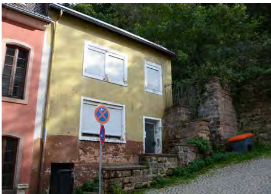
Sanierungsbedürftige Bausubstanz im Bereich der Fruchthallstraße zum Zeitpunkt der Bestandserfassung 10/2019