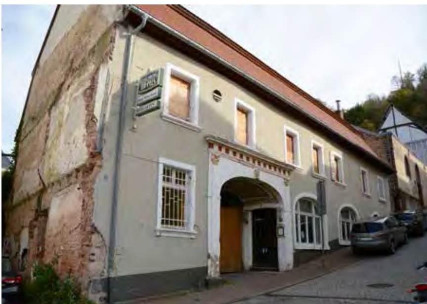
Sanierungsbedürftige Bausubstanz im Bereich der Klosterstraße zum Zeitpunkt der Bestandserfassung 10/2019

Ein Teil der Gebäude innerhalb der Altstadt ist demnach mittlerweile in die Jahre gekommen. Obwohl z. T. bereits investiert