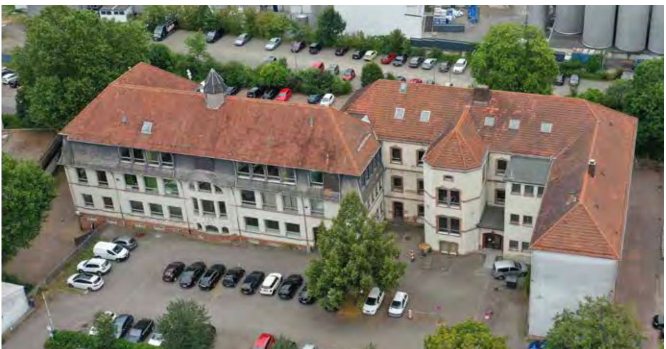
Gebäude der „Hohenburgschule“ mit Modernisierungs- und Instandsetzungsbedarf zum Zeitpunkt der Bestandserfassung 10/2019