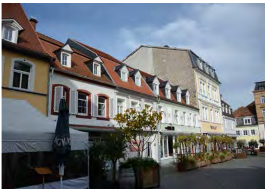
Schützenswerte Bausubstanzen im Bereich des Marktplatzes (Bestandserfassung 10/2019)

zen im Altstadtbereich und somit auch der kulturhistorisch wertvolle Stadtkern Homburgs insgesamt erhalten bleibt und die Sanierungsanforderungen aus Denkmalsicht beachtet werden.