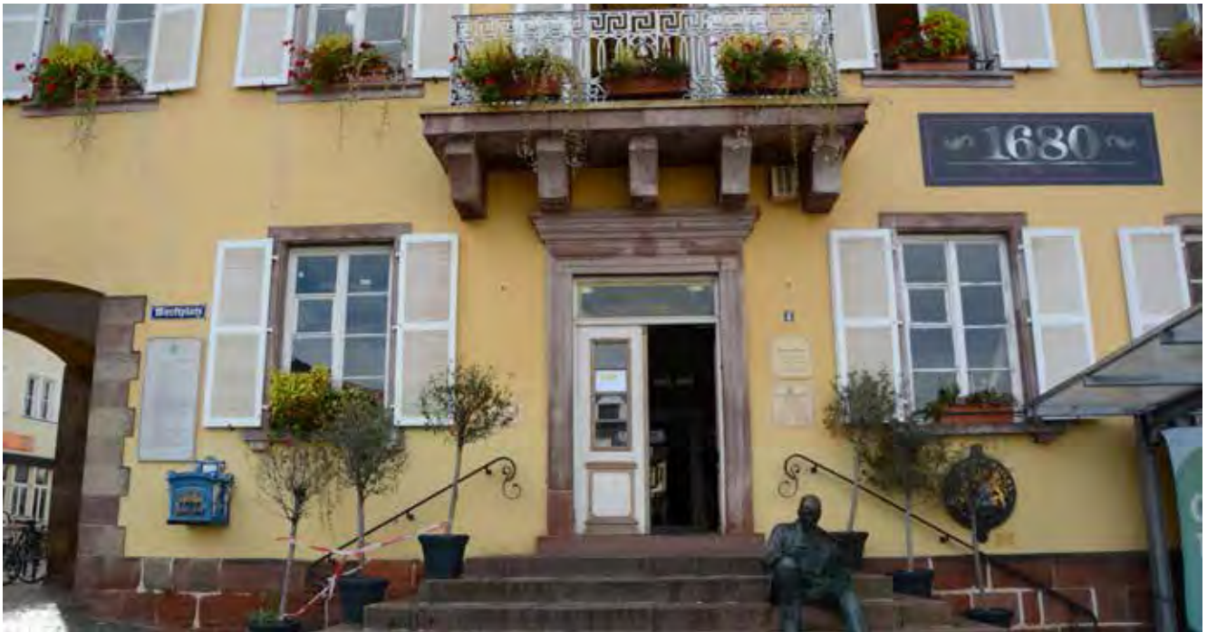
Denkmalgeschütztes „Altes Rathaus“ im Bereich des Marktplatzes mit Modernisierungs- und Instandsetzungsbedarf zum Zeitpunkt der Bestandserfassung 10/2019