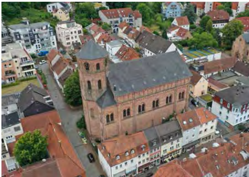
Schützenswerte Bausubstanzen im Bereich der Altstadt Homburg (Bestandserfassung 10/2019)