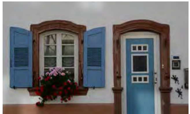
Attraktiv sanierte Fenster- und Türflächen zum Zeitpunkt der Bestandserfassung 10/2019