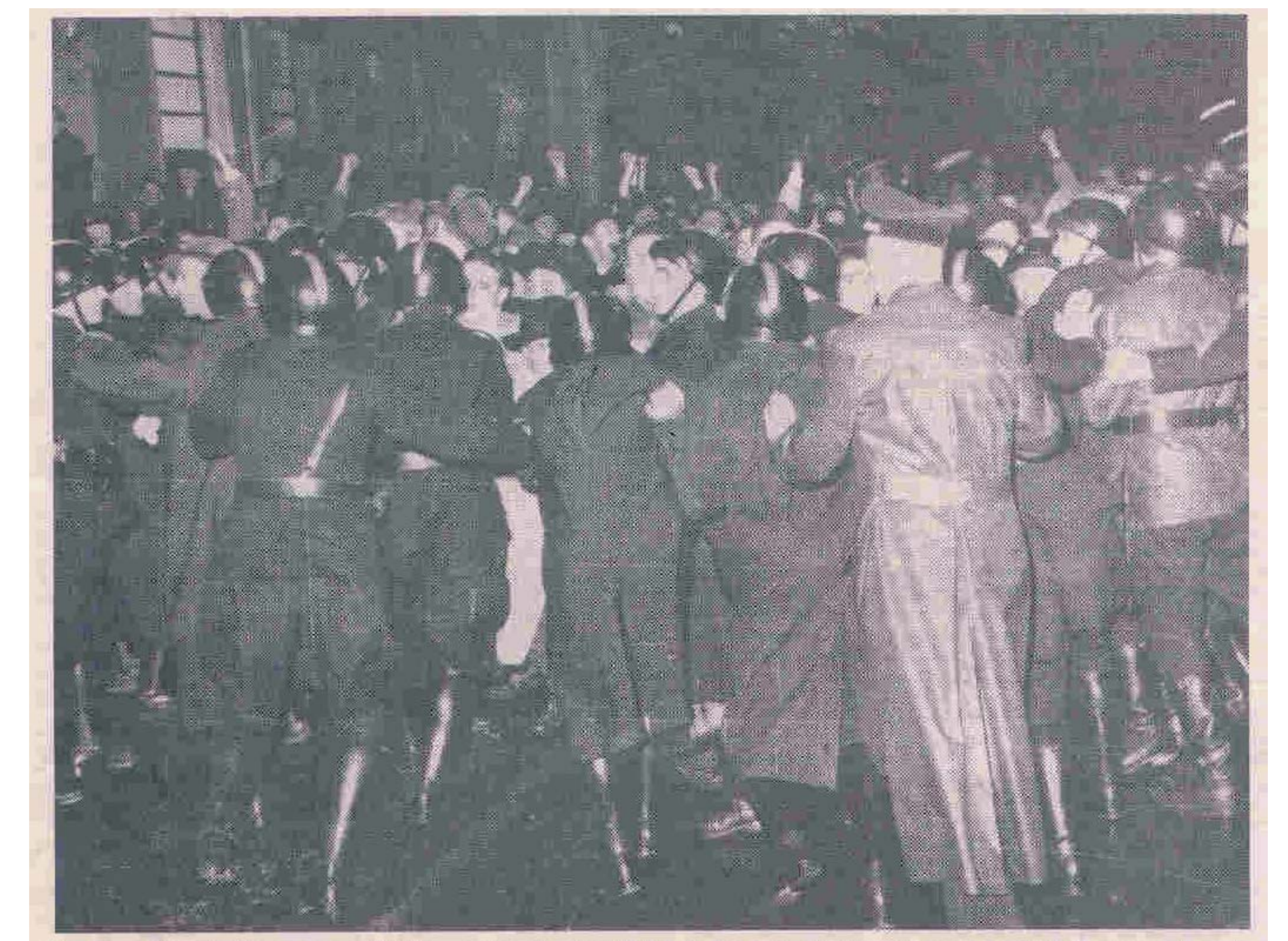
Konfrontation: Während des Wahlkampfes, der der Volksabstimmung vorausging, kam es zu Auseinandersetzungen, bei denen die Polizei einschreiten mußte.

Der Wahl- und Abstimmungskampf verlief äußerst leidenschaftlich. Es kam zu nationalistischen Überspitzungen, zu gewalttätigen Auseinandersetzungen und Übergriffen, die auch vor persönlichen Freundschaften nicht halt machten und in die Familien getragen wurden.