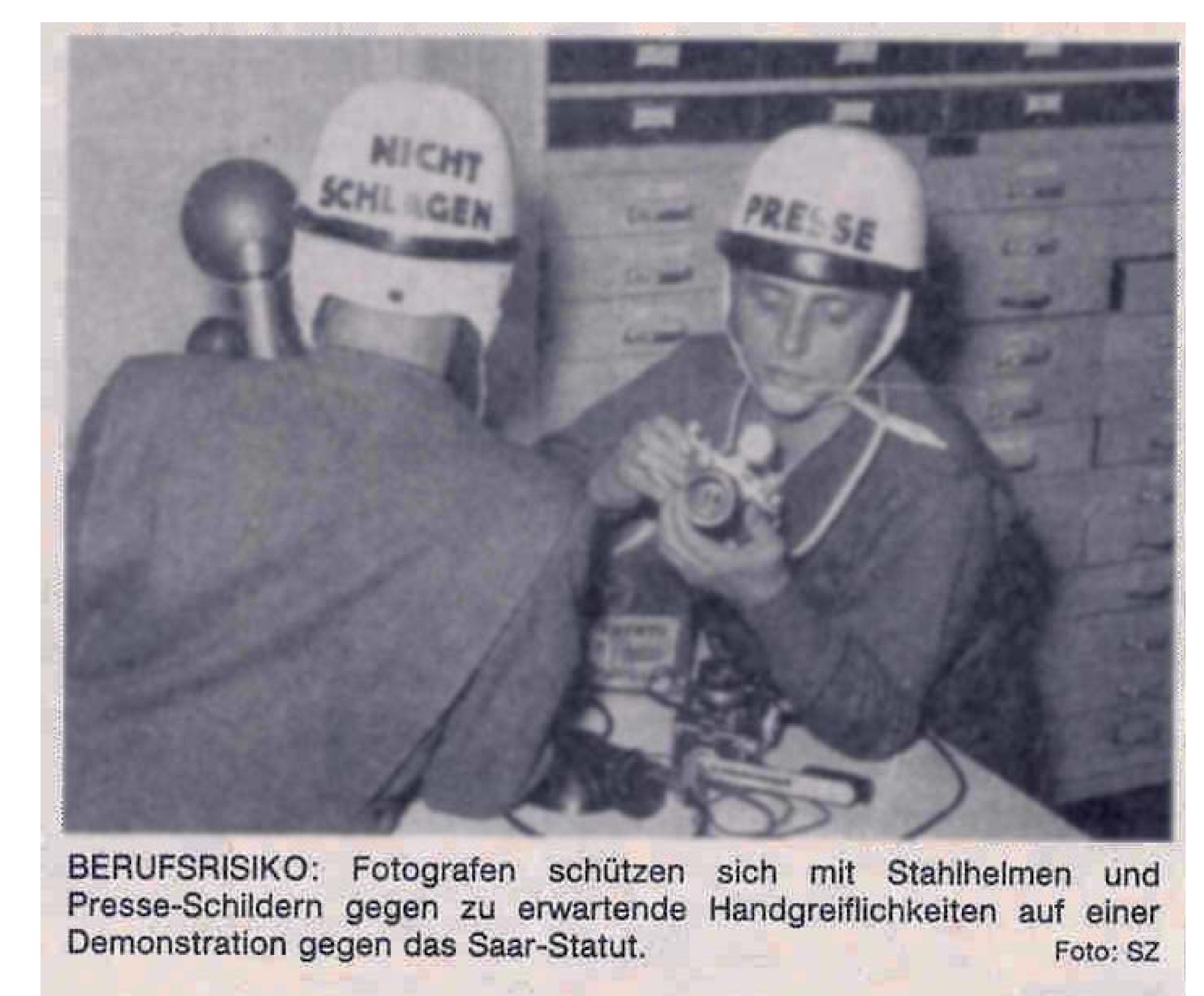
BERUFSRISIKO: Fotografen schützen sich mit Stahlhelmen und Presse-Schildern gegen zu erwartende Handgreiflichkeiten auf einer Demonstration gegen das Saar-Statut.

Tag der Rückgliederung, des politischen Anschlusses des Saarlandes an die Bundesrepublik Deutschland, die Geburtsstunde des Saarlandes als 11. Bundesland der BRD, ist der 1. Januar 1957.